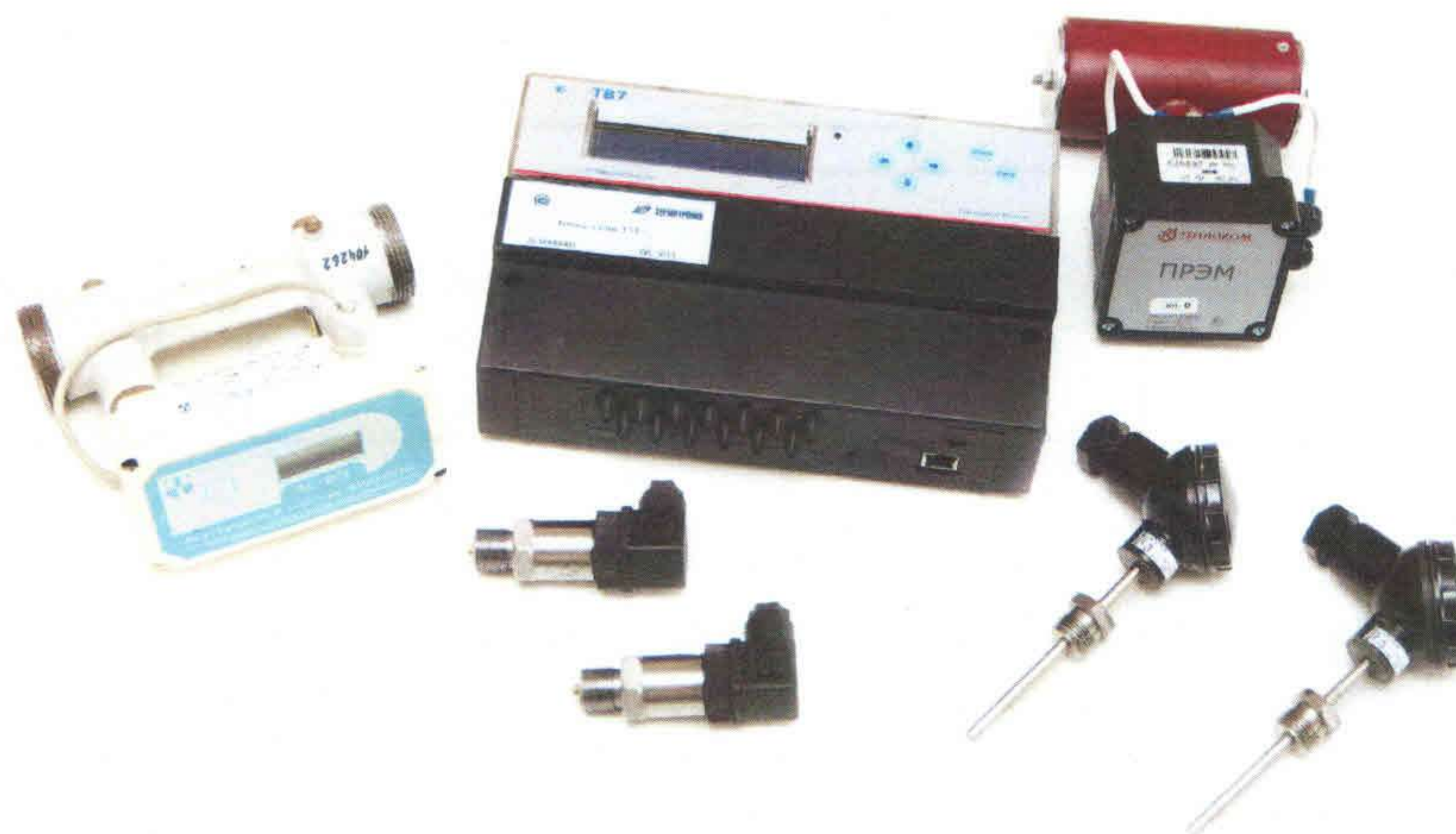
Рисунок 1 – Внешний вид теплосчетчика

Внешний вид теплосчетчика приведен на рисунке 1.