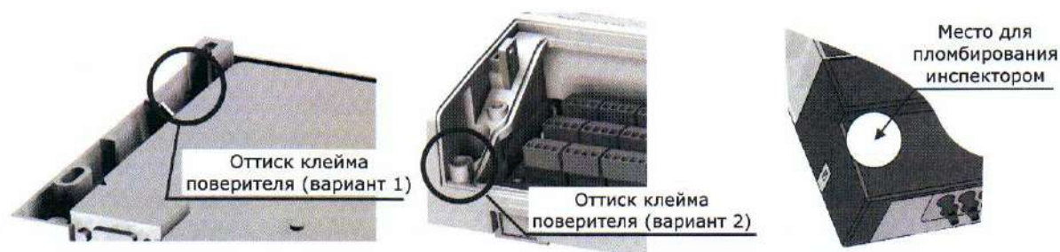
Рисунок 3 – Места пломбирования тепловычислителя