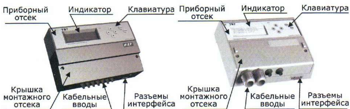
Рисунок 1 – Внешний вид тепловычислителя

Внешний вид тепловычислителя (два конструктивных решения) приведен на рисунке 1.